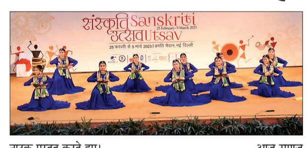
नाटक प्रस्तुत करते हुए।

नई दिल्ली। विश्व पुस्तक मेला 2023 में प्रस्तुत की नृत्य-नाटिका स्वाधीनता इस नाटिका के माध्यम से स्पष्ट किया गया कि आजादी किसी जाति, समाज व राष्ट्र विशेष की स्वतंत्रता तक सीमित नहीं अपितु इसका विषय है, वैश्विक स्तर पर, सर्वांगीण व्यक्तिगत नैतिक उत्थान। चूँकि व्यक्तिगत नैतिक उत्थान के साथ ही अखिल परिवार, समाज, राष्ट्र व विश्व का हित जुड़ा हुआ है इसलिए यह आजादी परिचायक है दैहिक बंधनों व भाव-स्वभावों से मुक्ति पाने की, स्वार्थपर, संकीर्ण पौराणिक वृत्तियों की दासता से स्वतंत्र हो जाने की, सांसारिक झड़टों व मानसिक प्रपंचों से निजात पाने की व एनैतिक विषयों और दोनों से बंधनमुक्त हो जाने की। हाँ, यह आजादी नाम है काम, क्रोध, लोभ, मोह, अहंकार जैसे विकारों से निजात पाने की, जन्म जन्मतारों की वासनाओं