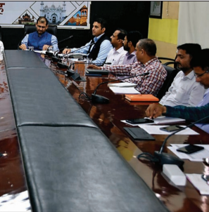
जिला प्रशासन के अधिकारियों के साथ बैठक की अध्यक्षता करते हुए।