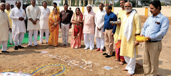
भूमि पूजन करते हुए लोग।