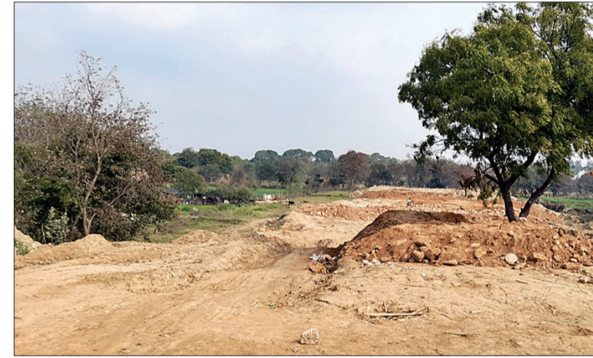
एफएनजी यहां बनेगा नोएडा को जोड़ने के लिए यमुना नदी पर पुल।

साथ नोएडा और गाजियाबाद से फरीदाबाद आने-जाने में समय भी काफी लगता था। इससे लोग बेहद परेशान हैं। इस परियोजना के बाद दूरी मिनटों की रह जाएगी। दोनों ओर के कामकाजी लोगों को आवागमन में आसानी होगी। कारोबारियों ने बताया कि उनके कई उद्योग नोएडा गाजियाबाद में लगे हैं। उन्हें अभी दिल्ली या केजीपी से होकर जाना पड़ता है। सीधी रोड बनने से समय के साथ ईंधन की भी बचत होगी। गांव लालपुर के पास यमुना नदी पर पुल बनाने का काम जल्द शुरू हो सकता है।